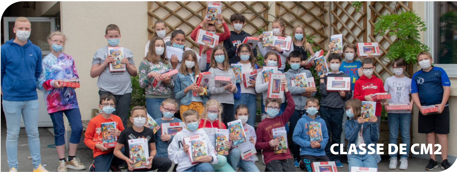
CLASSE DE CM2