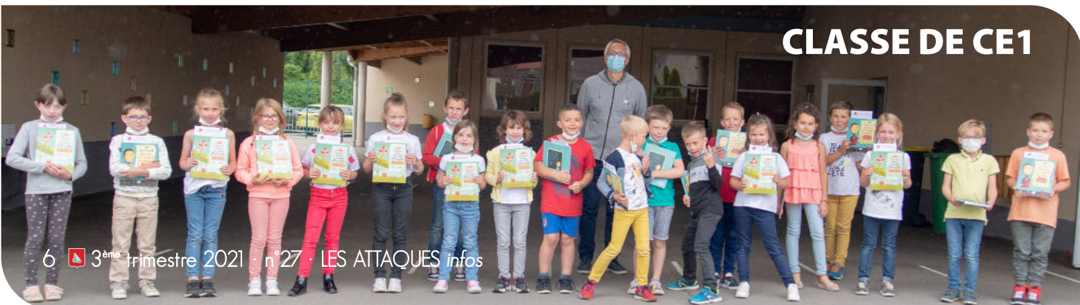
CLASSE DE CE1