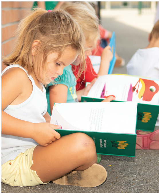
Rentrée des classes le 1er septembre