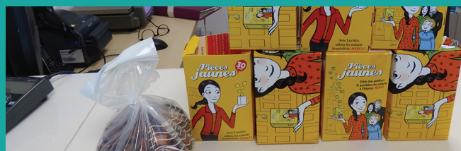
La générosité des Attaquois au RV de la collecte des pièces jaunes

L'Agence Postale Communale a fêté avec grand succès ses 3 ans le 18 mai. Les agents communaux assurent l'accueil du lundi au vendredi de 9 à 12 h, elles ont reçu 4 200 personnes en 2019 ! Soit en moyenne 18 personnes par matinée. Une tablette numérique est disponible gratuitement à l'agence pour consulter les sites des services publics et entreprendre des démarches en ligne.