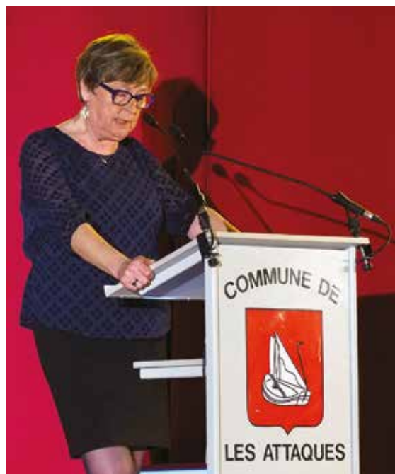
Compte rendu des vœux page 2, 3 et 4