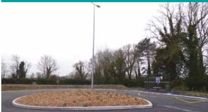
Un nouvel arrêt de bus à Pont d'Ardres

Le dernier chantier de l'année 2019 a été l'aménagement de la voie de demi-tour pour le bus à Pont d'Ardres sur la friche CUNO.