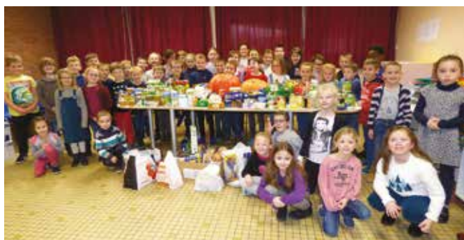
À l'école les enfants se sont largement mobilisés lors du challenge interclasses proposé par les enseignants.